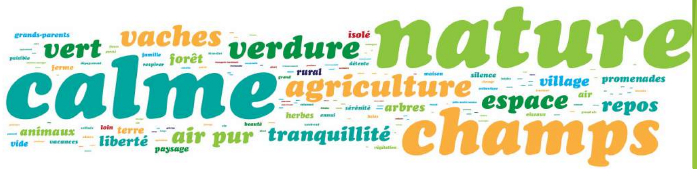
Figure : Les mots de la campagne pour les habitants de la Métropole du Grand Paris : "Quand vous pensez à la campagne, quels sont les trois mots qui vous viennent à l'esprit ?"